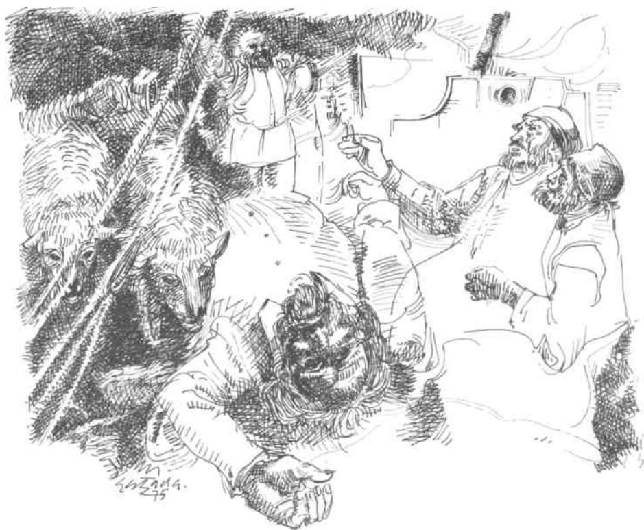
Ilustración de Adolfo Estrada